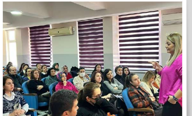
YUNUSEMRE İLÇEMİZE PROJE YAZMA EĞİTİMİ