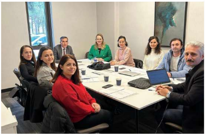
PROJE EKİBİ TOPLANTISI