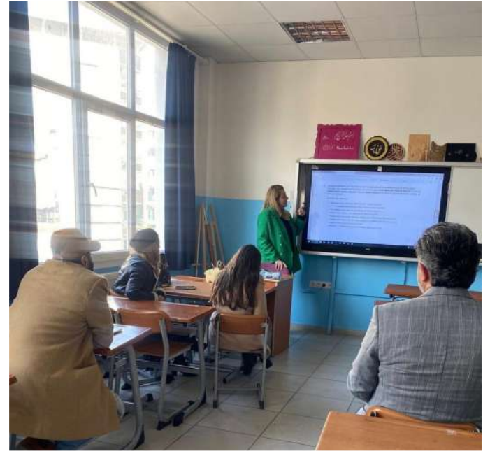
CELALETTİN ÖKTEM İMAM HATİP ORTAOKULU