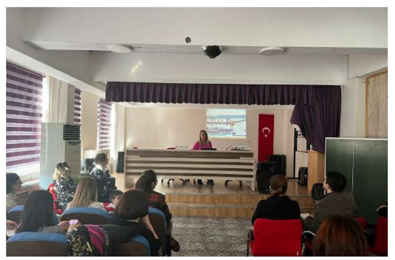
MAKER SCHOOL PROJEMİZİN TANITIMI