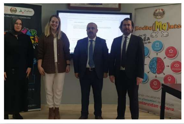
KODLAMANIŞA VE KENDİNYAP ATÖLYESİ