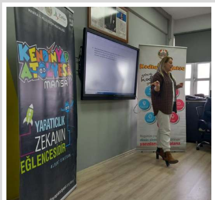
KODLAMANİSA VE KENDİNYAP ATÖLYESİ