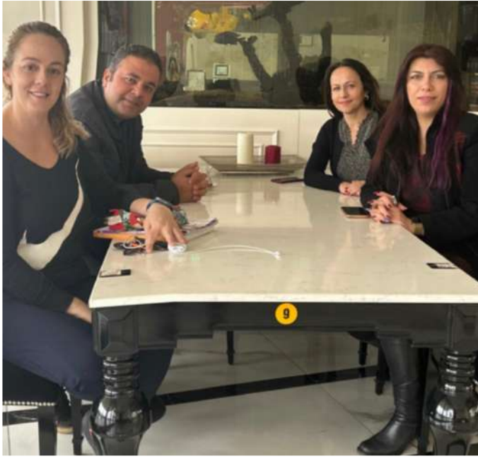
AHMET YESEVİ İMAM HATİP ORTAOKULU