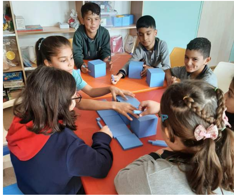
"Matematik Atölye Çalışmaları"